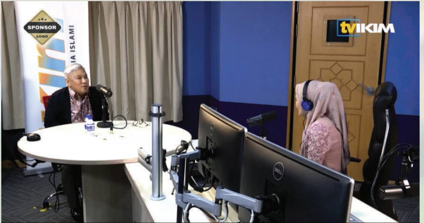
Rancangan ini dibawakan khas oleh SPONSOR. Hubungi talian 0162220999 untuk mendapatkan langganan buku terkini keluaran syarikat kami